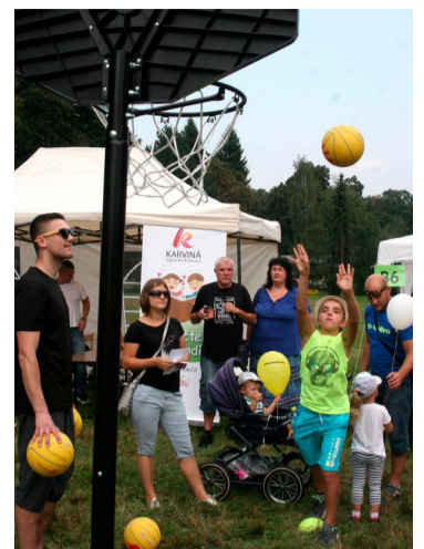
Neziskovci se zúčastnili celkem dvacet.