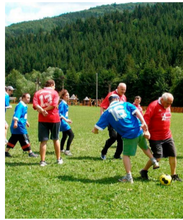
Došlo i na sportovní aktivity.