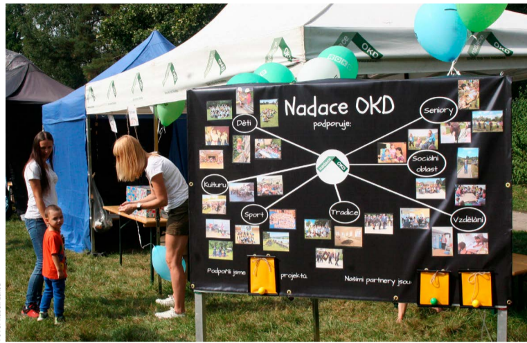
Nadace OKD pobavila ve svém městečku.

„Děti na stanovištích plnily různé sportovní i vědomostní úkoly. Jejich úkolem bylo například zdolávat překážkovou dráhu, nasadit hasičskou hadici na hydrant, namalovat správně obrázek, skládat puzzle, nebo správně uhodnout, co je na fotkách. Pro soutěžící jsme měli nachystáno spoustu krásných sportovních i jiných odměn, které poskytl také OKD. Nejvíce šly na odbyt nadační batohy a skládací lahve na vodu, jimiž jsme vybavovali budoucí školá-