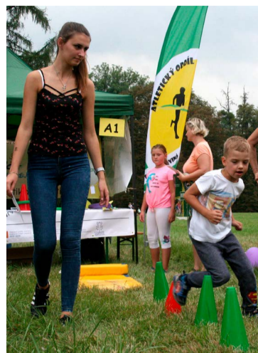
Překážková dráha od karvinských atletů.