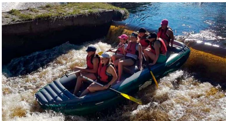
Pionýři z Orlové při sjíždění řeky Otavy.