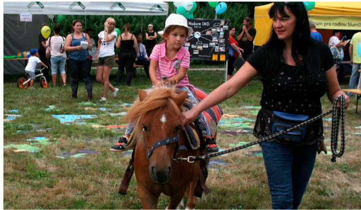
Jízda na ponících po nadačním městečku.

ci – vzhledem k začínajícímu novému školnímu roku – využila Hornických slavností i k náborovým akcím.