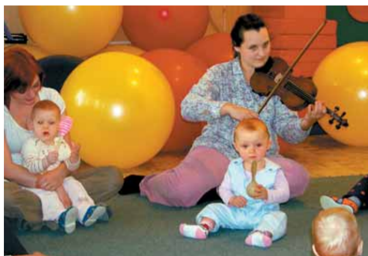
Chaloupka nabízí spoustu aktivit pro rodiče s malými dětmi.