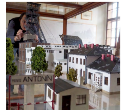
... a pak chystá Důl Antonín na výstavě.