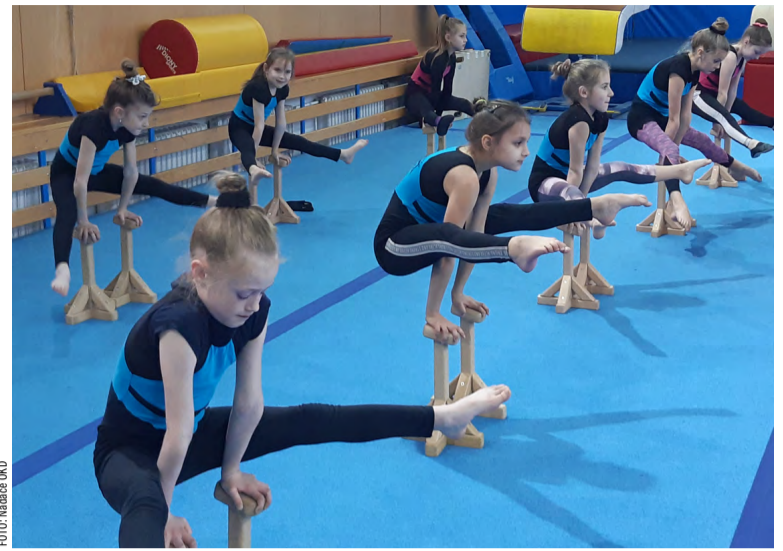
Takto vypadá cvičení s náčiním zvaným stálky.