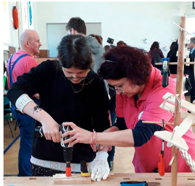
Abylimpiáda, soutěž pro handicapované.

„Zdravotně postižené děti a mládež ve věku od dvanácti do šestadvaceti let absolvovaly sedm stanovišť, kde plnily disciplíny jako aranžování květin, příprava nápojů či pokrmů ve studené kuchyni, plnění velikonoční pomlázky, mechanická mon-