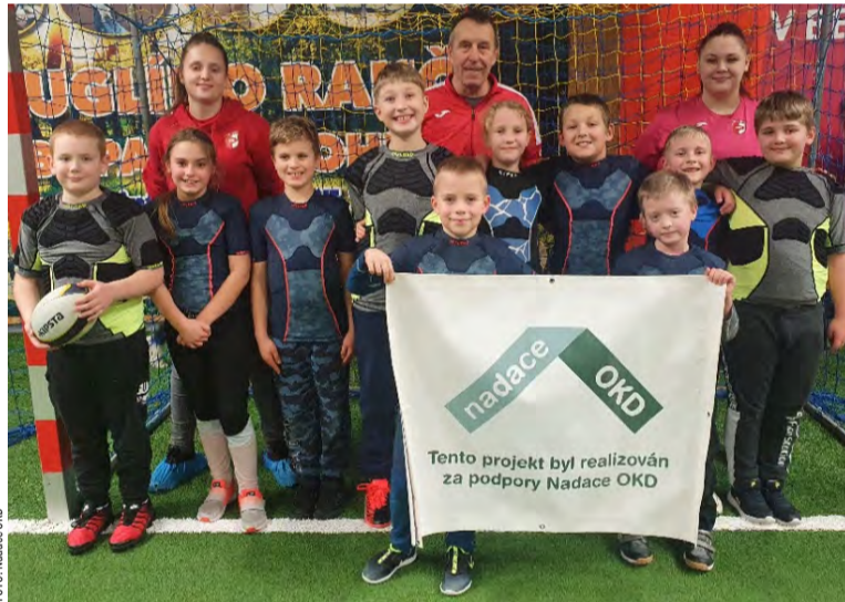
Ragbisté, mládežníci ve vestách pro lepší „skládání“ protihráče.

„Je to první Srdcovka a už pomáhá oživovat jinak docela skomírající sport,“ uvedl Kalousek s tím, že konkrétně do RCH nakoupily k nácviku