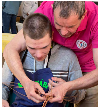
Nechybělo plnění velikonoční pomlázky.

táž, hrátky s drátky, práce se dřevem a malování na kamínky. Své výrobky odevzdávají porotě k hodnocení a ty nejkrásnější získaly ocenění,“ popisovala Balčíková.