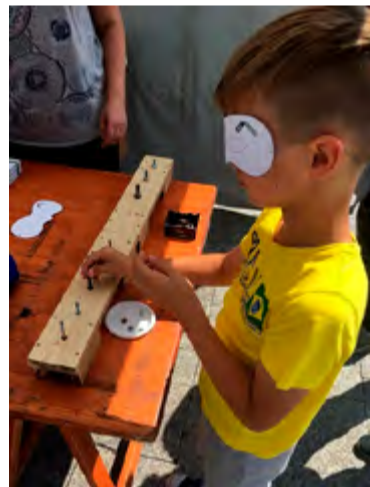
Šroubování poslepu na Dni pro rodinu v Karviné.