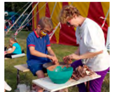
Workshopy na festivalu.

Podporovanými neziskovkami jsou Podané ruce (veřejná sbírka je ještě i ve čtvrtek 21. června na přehradě Olešná a ve tkalcovně Slezan