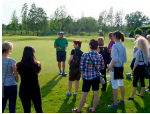
Program pro nadační partnery probíhal na golfu.