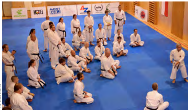
Setkání s japonským mistrem je zážitek, tvrdili karatisté.

Setkání s japonským velmistrem je vždy přínosné, zhodnotil olomoucký účastník, jenž se sám věnuje tomuto bojovému umění skoro čtyřicet let