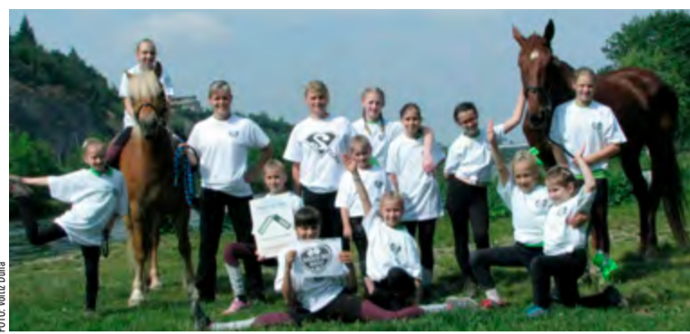
Cvičení srdcovkového karvinského oddílu na pražských závodech.