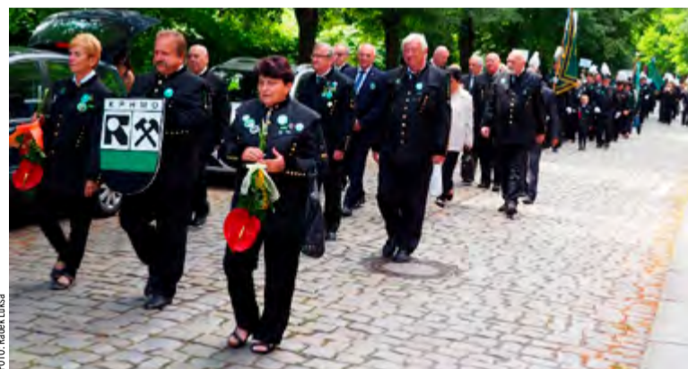
Společný průvod hornickým skanzem.

Klub byl založen v 1988 hned se vznikem tehdejšího Hornického muzea na šachtě nesoucí tehdy ještě jméno Urx. Jeho náplní se stala ochrana montánních i technických památek a historického odkazu hornické profese, pořádání odborných seminářů, přednášek i zájezdů a publikační činnost.