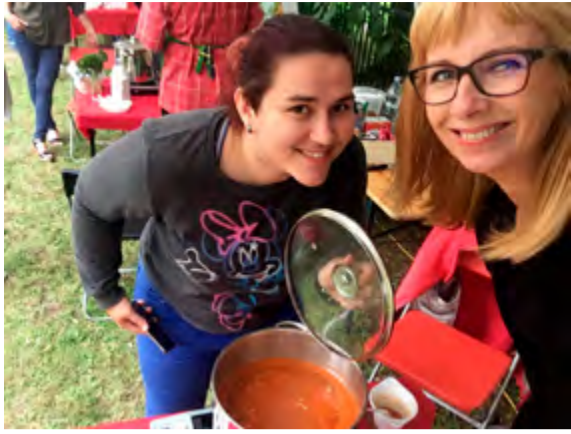
Nadační tým na akci Polévka je grunt v Havířově