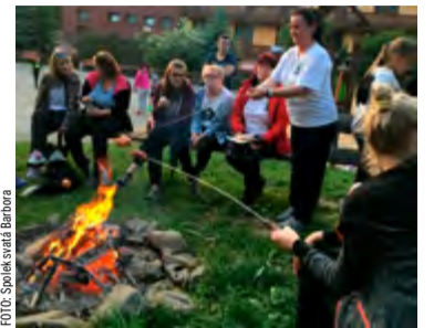
V programu bylo i posezení s opékáním špekáčků.

i současnosti tohoto vrcholu,“ popsala nejlepší okamžiky víkendu.