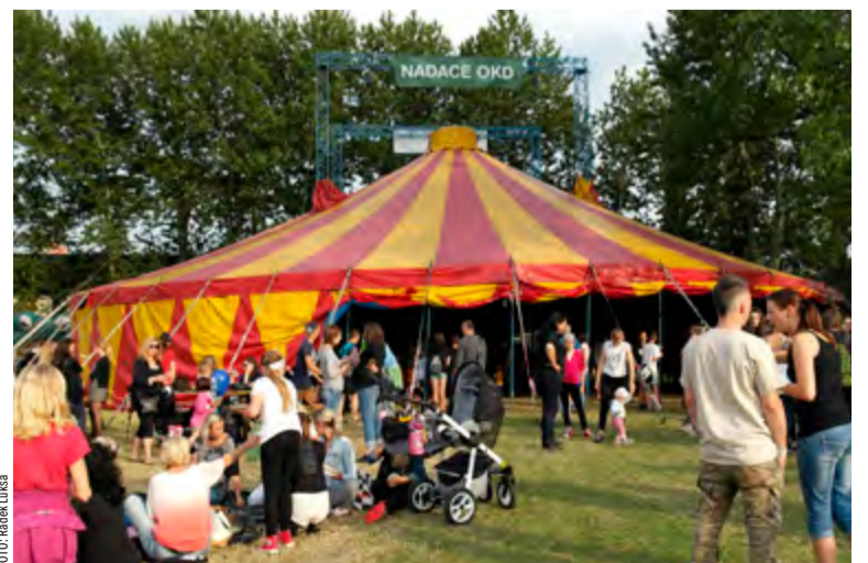
Nadace OKD podporuje na Sweetsen festu dětský program.

Sweetsen má letos v parku pod zámkem Dance stage, v bývalé tkalcovně Kultura FM Stage a Faunapark a na stadionu pak Pod Svícem Stage, Stoun Stage, Pavlač Šapitů, U Arnošta a REC.Stage. „Program myslí rovněž na děti, a to výtvarnými, fotografickými a keramickými workshopy pořádanými Střediskem volného času Klíč na téma Retro dovolená. Právě na tuto část festivalu máme podporu od Nadace OKD,“ vysvětluje Korč.