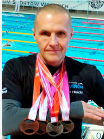
Horník se slušnou sbírkou medailí.