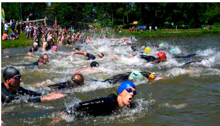
Brušperský extrémní triatlon se letos konal podvacáté.

Krásný závod, jehož dospělá kategorie čekaly disciplíny osm set metrů plavání, osmdesát kilometrů jízda na horském kole (trasa vedla i okolo Dolu Staříč) a čtyřkilometrového běhu, si nakonec užili všichni startující. „Důležité bylo, že se vše obešlo bez vážnějšího zranění, a tak můžeme s dobrým pocitem uzavřít dvacetiletou historii jednoho z nejpopulárnějších triatlonů v regionu,“ zakončil Holaník.