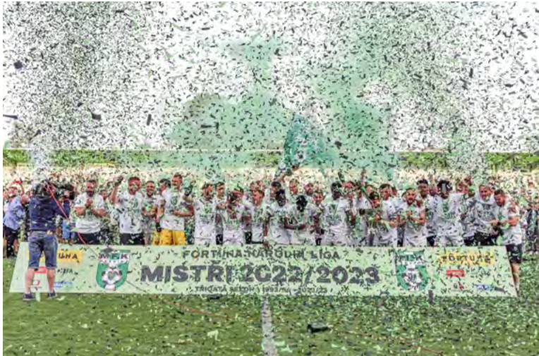
MFK Karviná oslavuje návrat mezi nejlepší české týmy.

KARVINÁ – Městský fotbalový klub (MFK) v jubilejní dvacáté sezoně dokázal s generálním partnerem, společností OKD, splnit svůj hlavní cíl: Karviná se pro sezonu 2023/2024 stane městem, kde se bude hrát nejvyšší česká fotbalová soutěž! Áčko v zeleno-černých hornických barvách skončilo na špičce druholigové tabulky s šestapadesáti body a o čtyři překonalo druhý Vyškov. Zahanbit se ostatně nenechalo „béčko“ ani dorostenci U18, kteří taktéž získali tituly.