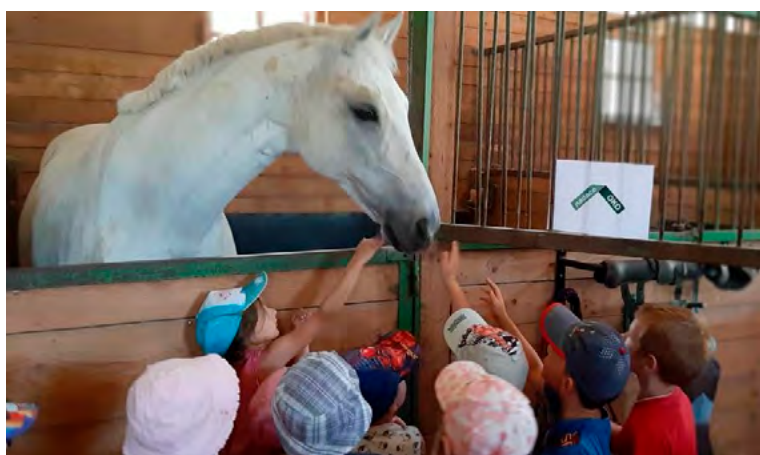
Cesta za poznáním, návštěva koňského ranče.