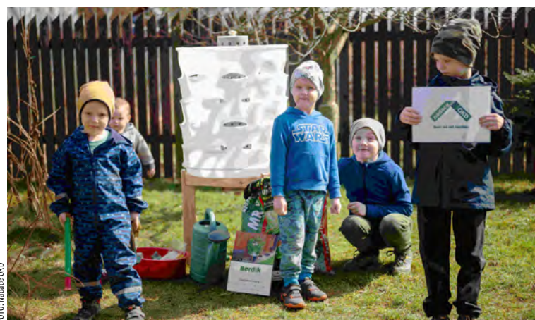
Berdík, kompostér a květináč v jednom, v MŠ Pohoda.

První projekt „Cesta za poznáním“ zahrnuje návštěvu koňského ranče ve Sviadnově či ZOO v Ostravě. „Děti