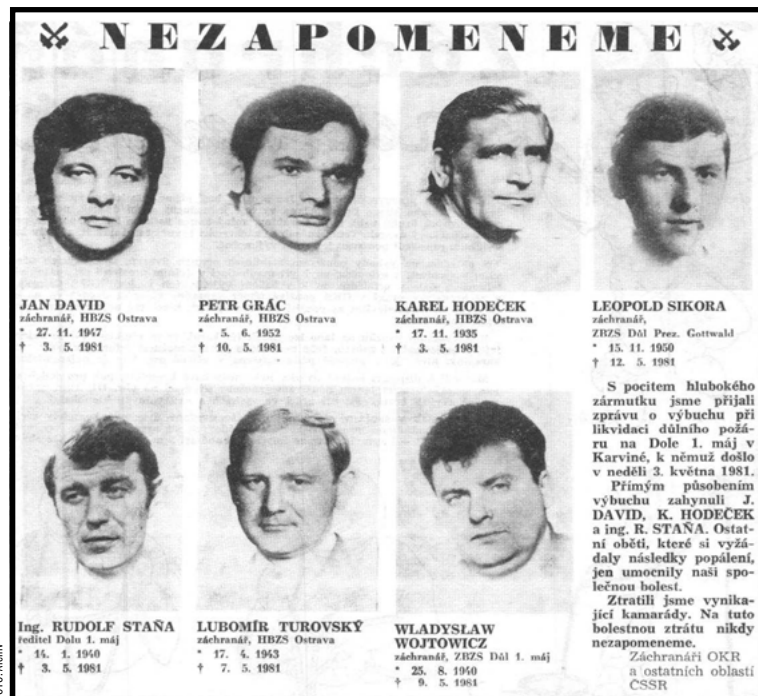
Parte obětí důlního neštěstí v dobovém periodiku.

„Přímý hasební zásah H2O se ukázal jako neúčinný, použití pěnového generátoru Turbex jako neefektivní. A co hlavně v požárním vodovodu - potrubí chyběl tlak. O víkendu byly uzavřeny hlavní ventily,“ komentovali to pamětníci. Vzhledem k šířící se požáru chodbou 40 360b tak padlo rozhodnutí - výbuchuvzdorně uzavřít oblast porubu i přiléhající chodbu sádrovými hrázezi. Při stavbě H1 však došlo v 16:58 k prvnímu výbuchu - zasáhl šestadvacet ze šestapadesáti báňských záchranářů nacházejících se tehdy v dole a též ředitel šachty. Druhá exploze následovala v 17:31. Výsledek. Tři mrtví na místě, dvaadvacet zraněných: jedenáct těžce a čtyři zemřeli v nemocnicích! O pře-