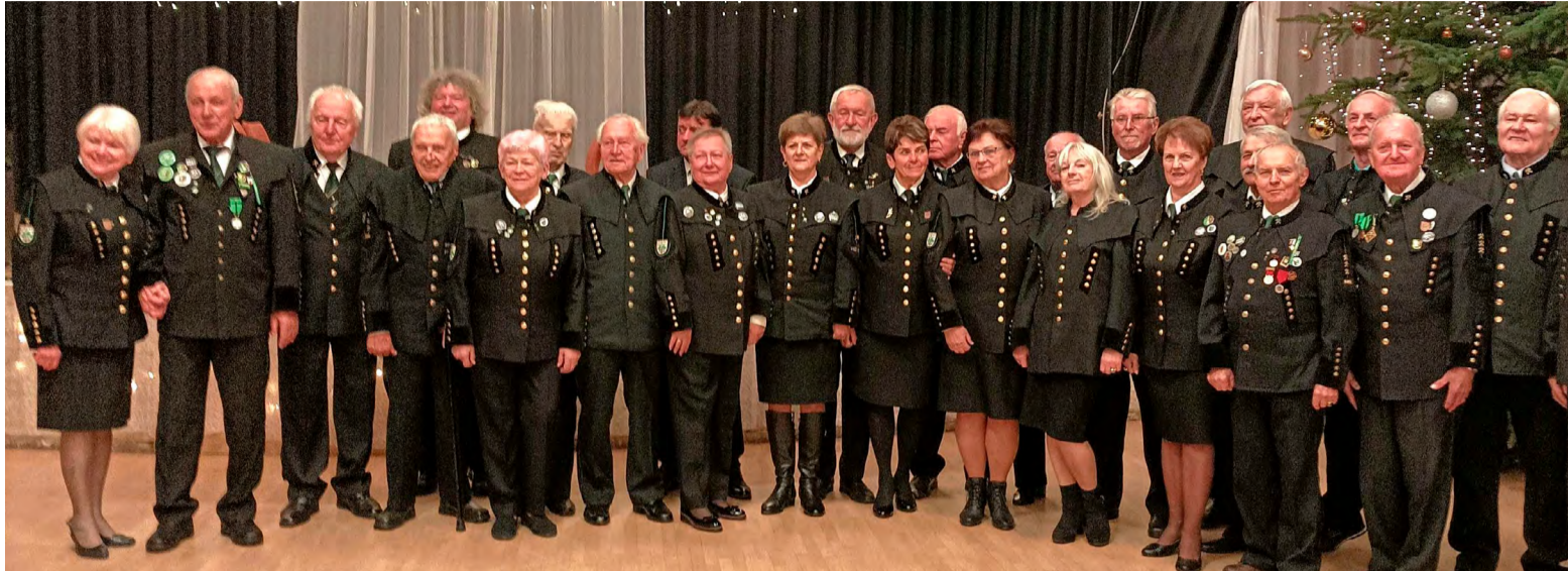
Horničtí důchodci Dolu František.