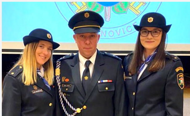
Ve stopách táty kráčejí obě jeho dcery.

Pomozte nám tvořit tuto rubriku! Máte zajímavého nebo neobvyklého koníčka, dokázali jste něco výjimečného a chcete se o to podělit? Nebo máte takového parťáka? Napište na barbora.cerna-dvorakova@okd.cz nebo zavolejte na 606 774 346.