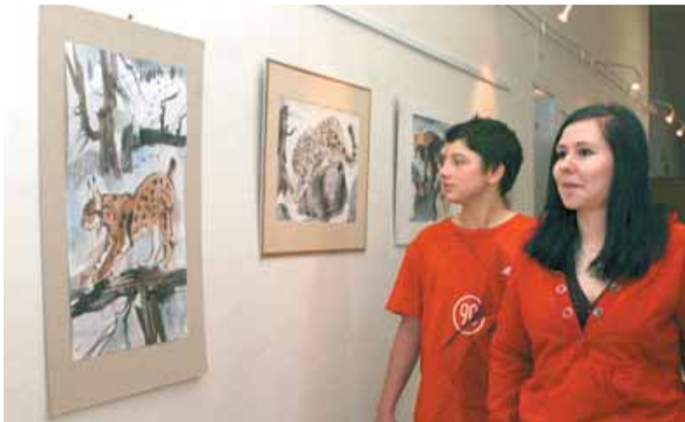
Na chodbě ostravské školy Gajdošova 9 vznikla skutečná galerie.

Základní škola Gajdošova 9 zrekonstruovala díky nadačnímu příspěvku Galerie Na chodbě