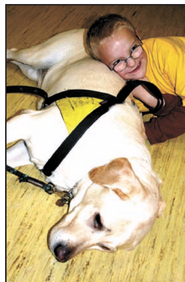
Labradoři zkoušeli i canisterapii.

Nadace OKD dotovala finále soutěže časopisu pro DD Zámeček padesátitisícovou částkou. A to v rámci programu „Pro radost a vzdělání“. Byla to téměř třetina všech nákladů na beskydské finále. V tom vyhrávaly děti – jejichž totožnost se nesmí bez souhlasu zákonných zástupců zveřejňovat – i hodnotné ceny. Mladší bicykl, starší mobilní telefon. Nejde ale jen o tyto věci, účastníci (svým způso-