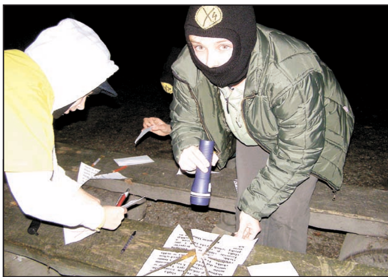
Jeden z nejnápinavějších úkolů pro Osu zla bylo noční šifrování.

bem sociálně znevýhodněné děti) mají být totiž motivováni k trvalé činnosti.