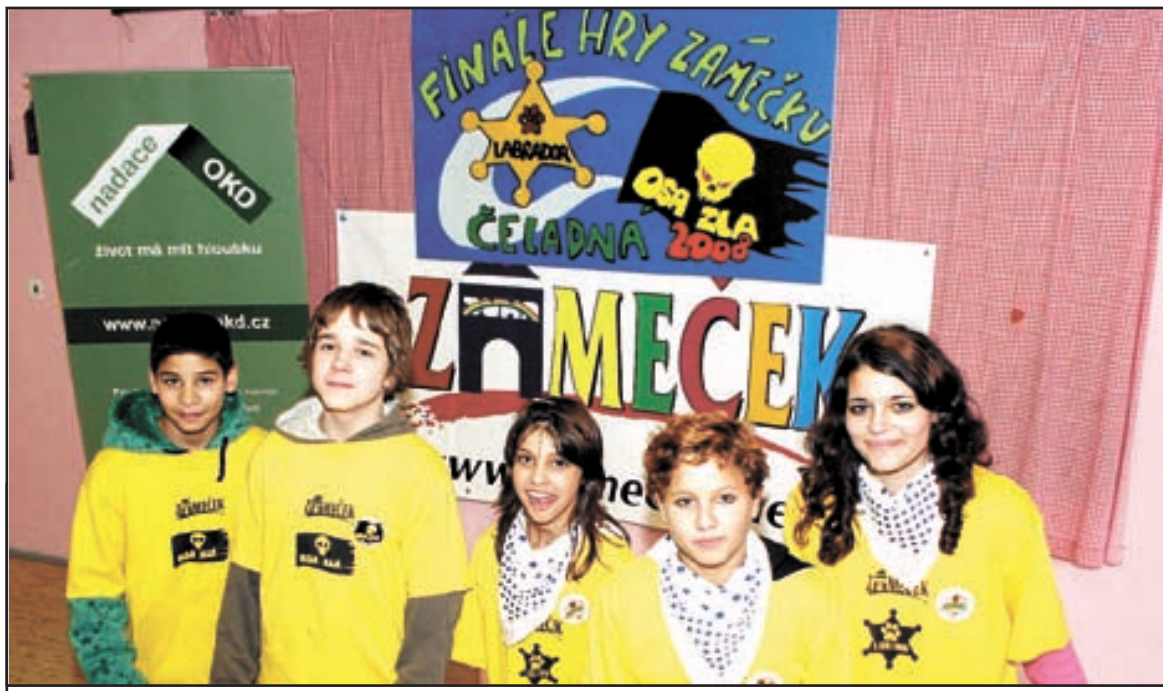
Děti z domovů měly v Beskydech velké finále celoroční hry časopisu Zámeček.