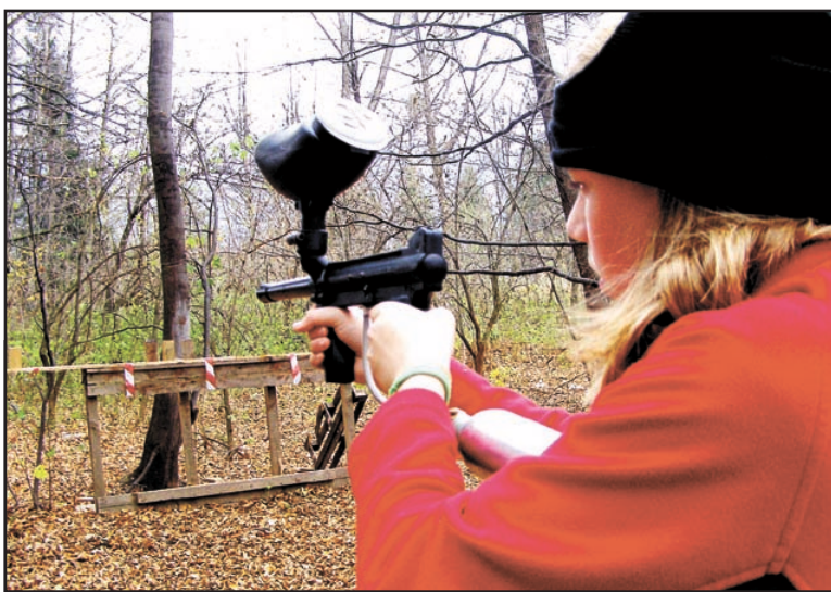
Dobrodružství zažili účastníci soutěže i na paintballové střílnici.