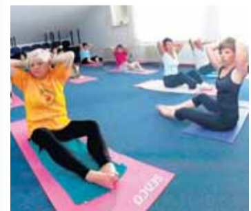
...na němž nechybělo cvičení pilates...

„Došlo i na výlety a poznávání přírodních a kulturních zajímavostí valašského regionu. Byli jsme za kouzelného pod-