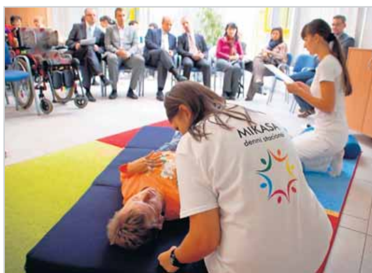
Fyzioterapeutka stacionáře MIKASA předvedla práci s postiženými.

„Naplánovali jsme si to tak, aby každý z nich měl týdně nejméně jednu pracovní hodinu, kdy může třeba hrát na hudební nástroje, cvičit prsty na hmatových deskách či pozorovat světelné paprsky. A nejméně jednu hodinu relaxační s uvolňující hudbou, uklidňujícími světly, různými aromatic-