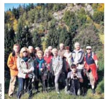
...ani společné vycházky do přírody.