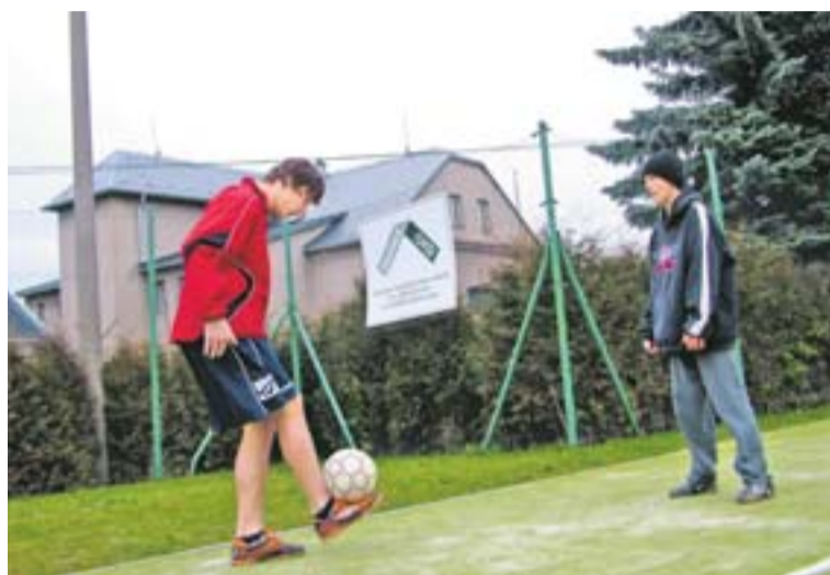
Budišovský dětský domov má hřiště pro klienty, ale i jejich spolužáky a kamarády.

„Díky strejdům, tedy vychovatelům, kteří jsou sportovci, to velmi často nandáváme ostatním v turnajích. Hlavně ve fotbalu, nohejbalu či florbalu. Hřiště je víceúčelové, takže se můžeme ještě více zdo-