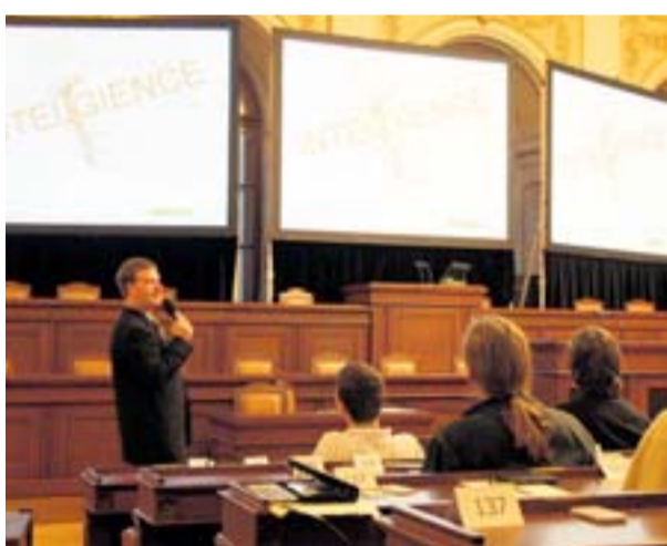
Poslanecká sněmovna patřila finále soutěže Logická olympiáda...

„Sněmovna nám na jeden den výrazně omládlá. Sjezly se do ní děti a mladí lidé nadaní přinejmenším stejně jako politikové, kteří v ní běžně zasedají,“ uvedla Alena