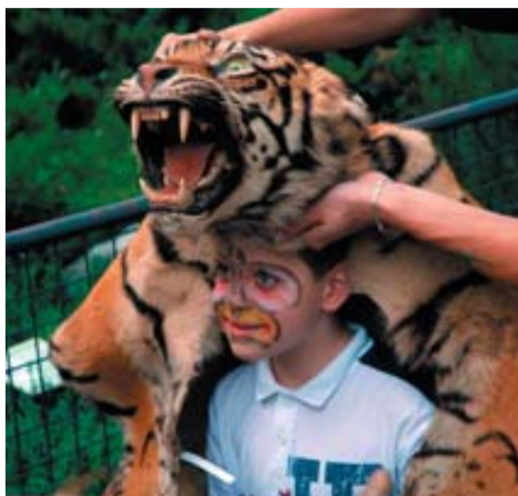
Děti si mohly osahat kosti, lebky nebo zvířecí kůže.