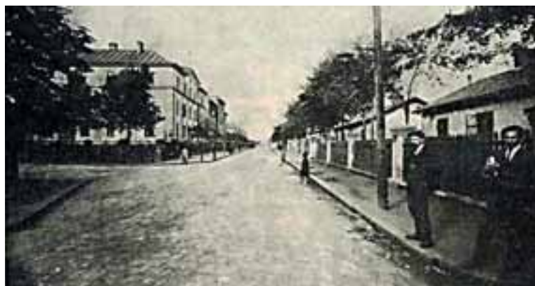
Kolonie u jámy Františkovy, 20. léta 20. století.