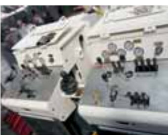
Ovládací pult pro řízení dvou lafet.