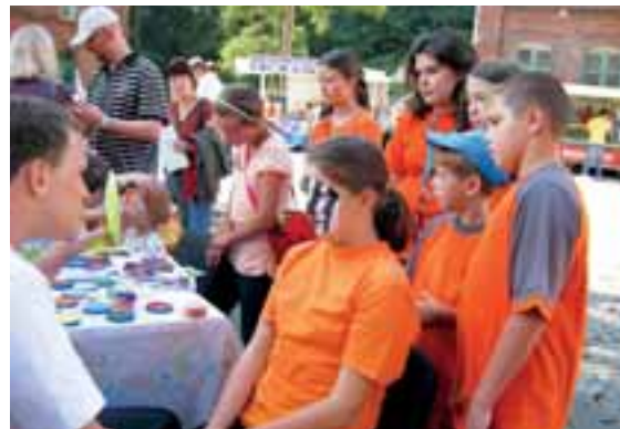
i venku v takřka celém areálu Landek Parku.

Ti, kdo zdárně absolvovali soutěžní disciplíny a odpověděli správně na kvíz, byli zařazeni do slosování o zajímavé ceny. Úplně na všechny pak v závěru čekaly pěkné dárečky – létací talíř, omalovánka, pexeso, magnetky a sladkosti. Vše ve firmní barvě. kk