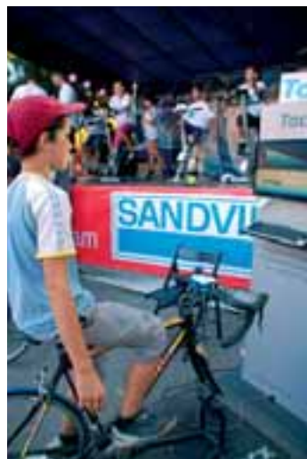
Na Hornických slavnostech v Karvině se „jelo“ do dalekého Sandviken.

Stojí za zmínku, že celá akce uspořádaná týmem Sandviku nebyla samoučelná. Stejně jako ukázky biketriálových a cyklistických dovedností sloužila propagaci zdravého stylu života, kde – a to určitě nejenom ve švédských podmínkách – sehrává bicykl mezi dětmi významnou úlohu.