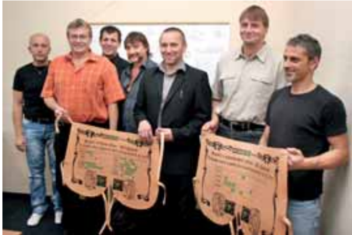
Paskovské srpnové „limitáky“ byly tři na čelbách a jeden v rubání.

Po „nekonečném“ lepení nadloží a zavrtávání TH rovin se podle výrobního náměstka obrátila ve druhé