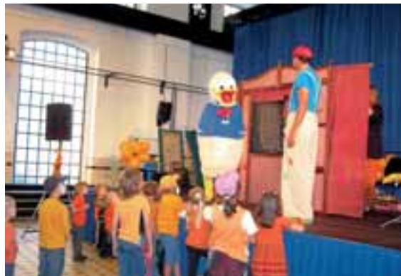
Děti se bavily v kompresorové šachtě Anselm...

V Praze děti přivítala zvířátka. U Tučňáka museli kluci a holky například ulovit rybkou, Koník půjčil své podkopy k hodů na cíl, s Opicí děti šplhaly po lanové síti. Zebra si nachystala dopravní dráhu se značkami a semaforem a dávala také záluďné otázky, např. kam telefonovat v případě dopravní nehody. Také kvíz AWT na obou místech byl koncipovaný v duchu dopravy. Děti se dozvěděly, jaké druhy přepravy skupina AWT, kde pracují jejich rodiče, prarodiče nebo tety a strejdové,