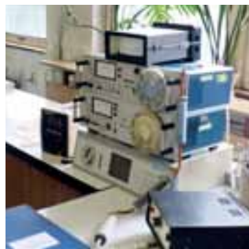
Digitální sestava pro rozbor vzorků plynů.

V laboratoři Odboru řízení a kontroly jakosti Dolu Darkov je přístrojové vybavení obdobné jako v jiných laboratořích OKD. Díky tomu jsou při každoročních mezilaboratorních zkouškách výsledky testů prováděných na jednotlivých pracovištích plně srovnatelné. Jako v každém oboru, i v laboratořích jde ale vývoj rychle kupředu.