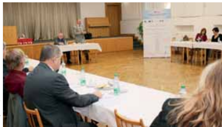
Z obrad workshopu w sprawie państwowej koncepcji energetycznej w dyrekcji OKD w Ostrawie.

Problematykę gospodarki energetycznej analiza postrzega nie tylko