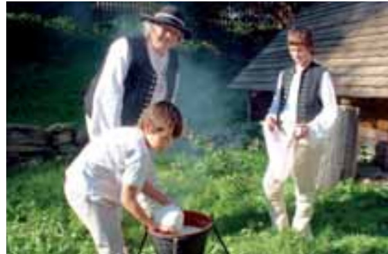
Příprava domácího ovčího sýra podle původních postupů.