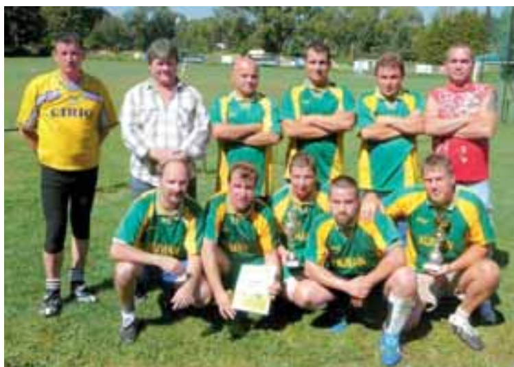
Vítězné družstvo úseku SLD-2.