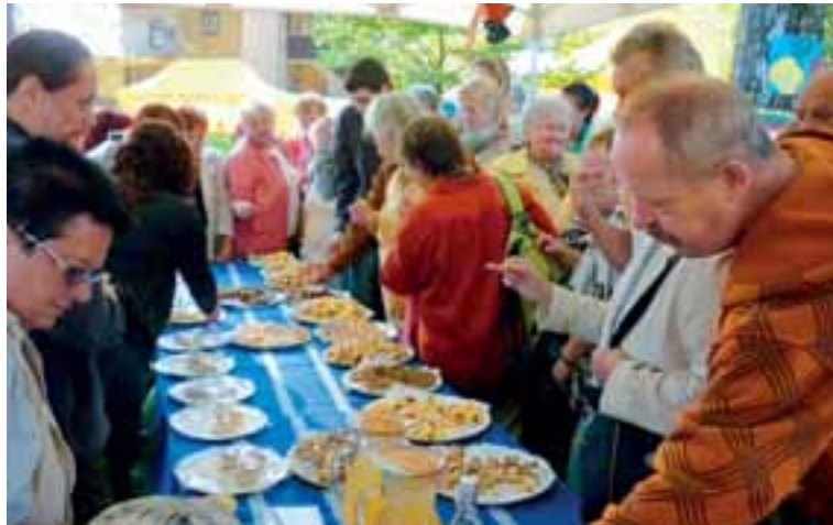
Díky Nadaci OKD prožil Jablunkov v pátek 16. září svůj Jabkový den.

Speciality místní goralské kuchyně nabízeli členové Místní skupiny PZKO Jablunkov, další program pro děti byl v režii jablunkovského