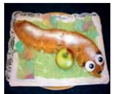
Veselé jablečný závin chutnal stylově.

Domu dětí a mládeže. Během celého odpoledne probíhalo představení poskytovatelů sociálních služeb Jablunkovska.