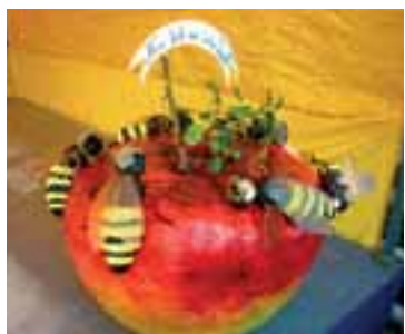
Při malování jablek a jabloní se vyřádily děti.

JABLUNKOV – Jabkový den pro radost všem! Takové bylo hlavní motto jablunkovské akce uspořádané v pátek 16. září díky pomoci Nadace OKD, a opravdu tento den pro radost byl! Pokud jste zamířili do parku za jablunkovskou radnici, určitě jste si našli to své. Počasí bylo nádherné, všude se hemžili návštěvníci, kteří se mísili s členy folklorních