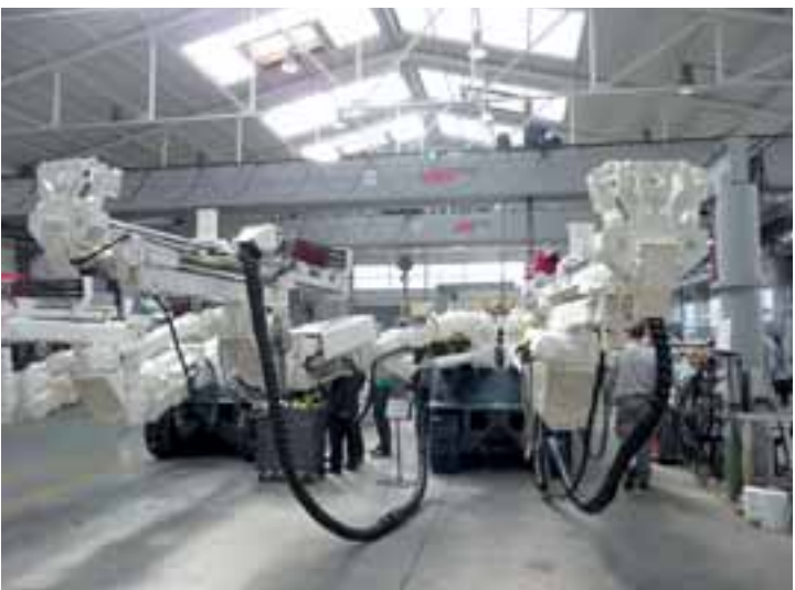
Dvoulafetový vrtací vůz typu DH-DT 2 při předváděcí akci v dílnách výrobce v Dortmundu.