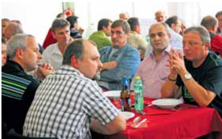
Účastníci porady hlavních předáků Dolu Karviná.

„Chci poděkovat celému kolektivu našeho dolu. Přes mimořádné události, které nás potkaly, si dokázal udržet morálku, stmelil se a řešil věci s klidnou hlavou. Pokračování na straně 4