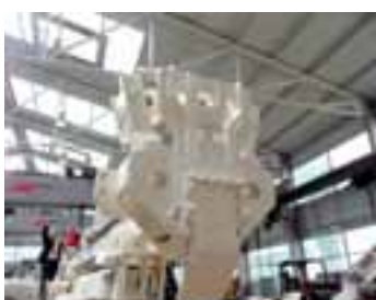
Detail čela vrtací lafety.