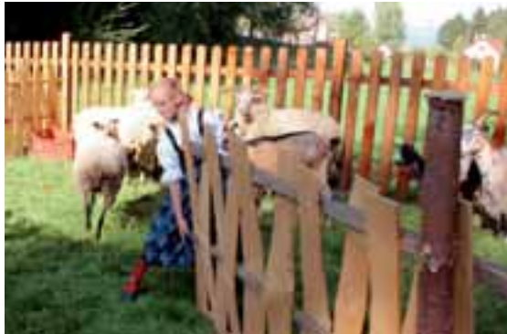
Zahánění ovcí ze salaši nazpět k přezimování v dolinách.

karnevalového průvodu organizací podpořených Nadací OKD. Nepřehlédnutelná byla jejich koza; i díky ní byli vyhodnoceni jako třetí