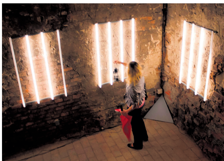
Světelná instalace ze studentské expozice.

„A bude to opět multižánrová akce s domácí atmosférou pořádaná nejen na farní zahradě, ale i přímo v prostorách kostela sv. Jana Křtitele, a zaměřená na nekomerční hudební i divadelní projekty. Duchovně inspirované umění se tady setkává s tvorbou odrážející kaž-