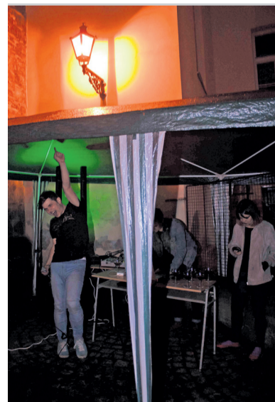
Také v kostelní věži se dokážou lidé bavit.