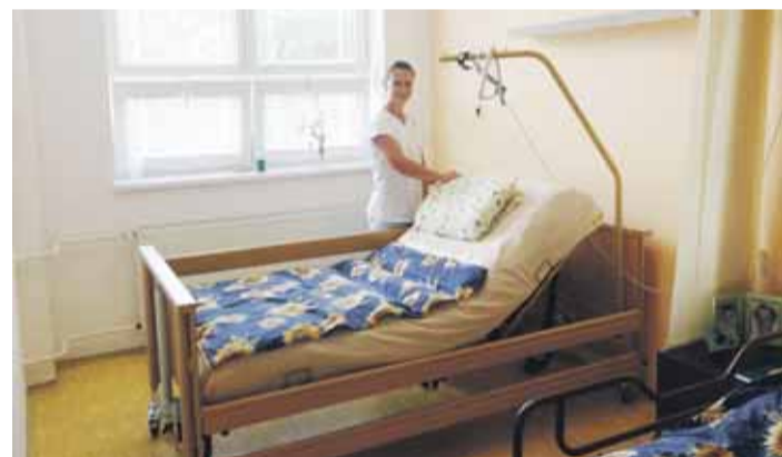
Nové postele pořízené z grantu těžařské nadace zlepšily komfort v DS Pohoda.

Kompenzovat hendikep – zkvalitnit život a Cesta k vyšší soběstačnosti, tak nazvali v domě pro seniory projekty na pořízení speciálních postelí pro imobilní uživatele.