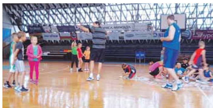
Týdenní program se uskutečnil v Bonver Areně, dříve známé jako hala Tatra.

včetně revitalizace bytového fondu v Karviné, Orlové či Ostravě-Porubě. Nyní působí v divizi Služby. Má na starosti oddělení volných bytů, spadají pod něj i veškeré jejich opravy.