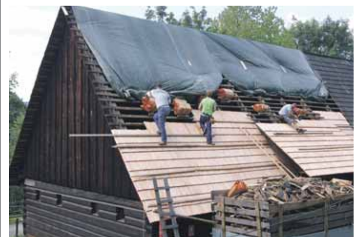
Střechu opravovali tradičním řemeslnickým způsobem.