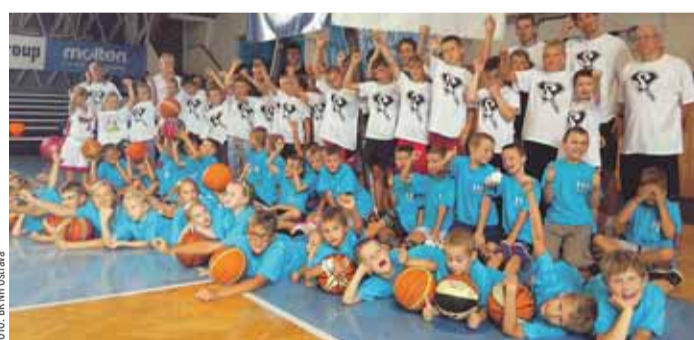
Třetí ročník příměstského basketbalového kempu proběhl i díky Srdcovce.

„První ročník měl čtyřiatřicet účastníků, druhý dvaapadesát