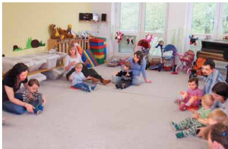
Klokánek se těší vysoké návštěvnosti, zájemci se musí registrovat.

Loni Klokánek získal příspěvek ve výši 70 tisíc korun. Díky tomu si mohli místo jedné „tety“ neboli speciální pedagogické asistentky jich dovolit hned šest. Letos byla NOKD štědrější, a tak se 120 tisíc korun mohlo použít nejen na platy, ale například také na pořízení pěti „hopsadel“ na zahradu školky.