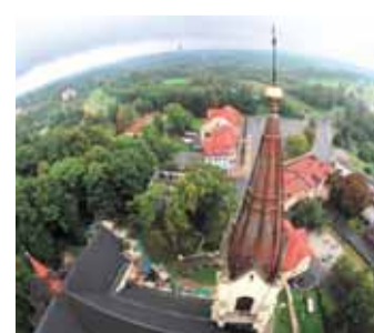
Pohled v věže orlovského kostela.