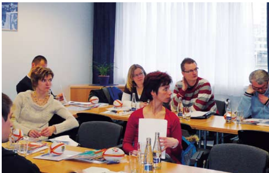
Na školení se sešla spousta pedagogů

V první polovině března navštívili pracovníci nadace školení sportovně-sociálního projektu prevence kriminality Sport bez předsudků (SBP), které se konalo v ostravském hotelu Puls. Jeho hlavním cílem je zapojení co největšího počtu dětí a mládeže do nepravdivých, ale i pravidelných sportovních aktivit. Kromě seznámení s novinkami v projektu SBP na rok 2009 a teoretické části se pedagogové zúčastnili promítání metodického snímku o ragby. Po projekci přišla řada na představení nových pomůcek, které budou pro letošní rok zařazeny do tréninku atletiky. Akce byla velice zdařilá, plná fandění a soutěžní atmosféry.