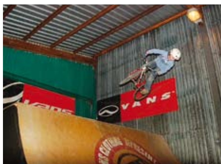
Nadšenec prohánějící se po U-rampě

Wheel klub z Karviné mohl minulý rok díky Nadaci OKD pohodlně rozjet projekt pod názvem „ Tréninkové centrum “ a právě na něj navazuje projekt rekonstrukce stávajícího skateboardového parku.