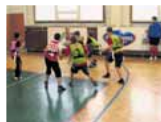
...zapojili do Sportu bez předsudků.

„Děti se místo lenošení u televize či počítače učí efektivně využívat svůj volný čas, posilovat své fyzické i psychické dispozice i rozvíjet svou osobnost a smysl pro zodpovědnost,“ doplnil tým Sportu bez předsudků s tím, že na jaře bude vše opět pokračovat. uzi